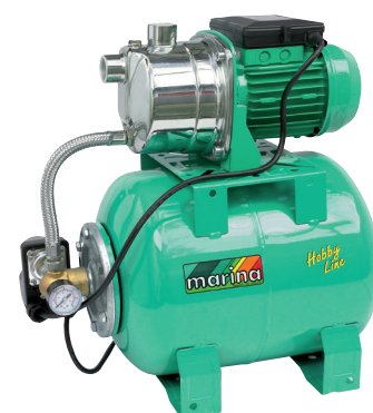
CAM 80/22 HL

P1 800 watt Q max. 50 l/min 1,4 ÷ 2,8 bar