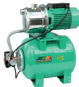
CAM 88/22 HL

P1 800 watt Q max. 50 l/min 1,4 ÷ 2,8 bar